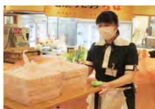
家族レストラン坂東太郎 石岡総本店