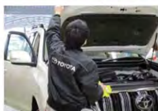
(株)ハタヤモータープール