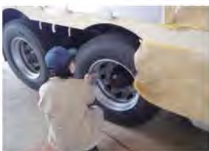
山田車体工業(株) 水戸工場

2年次に行ったインターンシップを発展させた「デュアルシステム」を実施しています。学校では体験できない多くの実践を積み重ねることができます。デュアルシステムで体験した職種に就職することもできます。令和2年度は10名の生徒が別々の事業所で12日間お世話になりました。