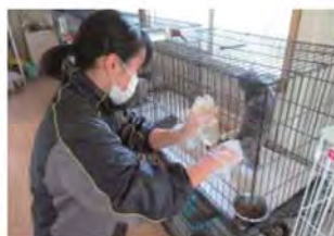
(株)One Do (犬の牧場)