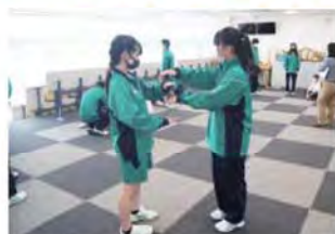
ツインリンクもてぎ (オリエンテーション)