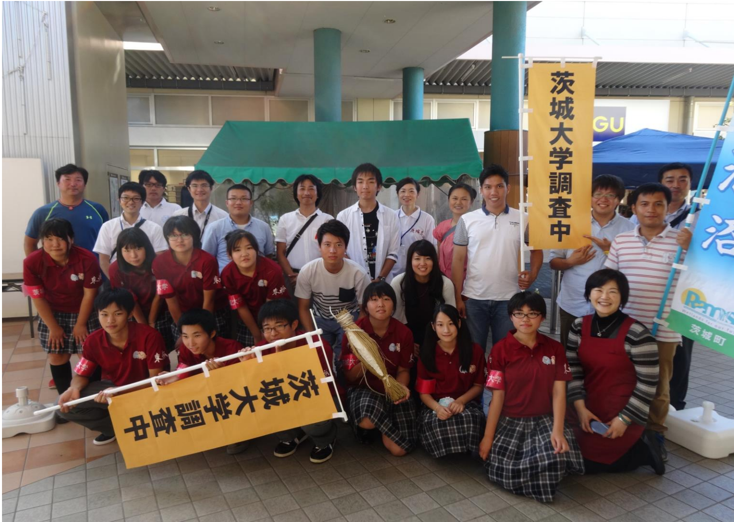
【長時間にわたる調査後、参加者全員で記念撮影を撮りました。みんないい笑顔です◎】

アセン ンター ケート ト調査 に本校 も参加 しました ! 平成28年9月10日(土)イオンタウン水戸と南